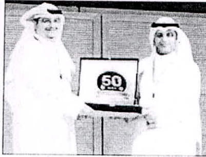
تدريب المنيخ والمشري خلال الملتقى

أعلنت شركة الاتصالات الكويتية VIVA، مشغل الاتصالات الأسرع نمواً في الكويت عن مشاركتها في الملتقى الثاني للاتصالات في الكويت، والذي أقيم في المعهد العالي للاتصالات والملاحة بالتزامن مع احتفالية المعهد باليوبيل الذهبي في الفترة بين 1 و4 مايو 2017، بحضور مدير المعهد الخائب منذر الخضري ومدير عام الهيئة العامة للتعليم التطبيقي والتدريب د. أحمد صباح الأثري.